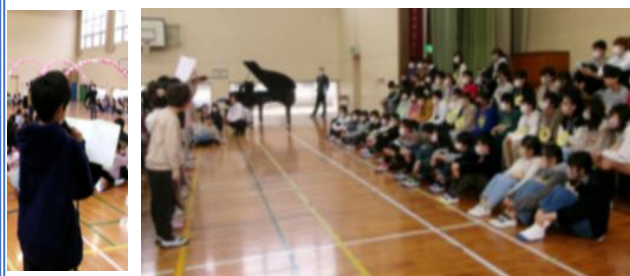
↑ 進行役の5年生と、発表を見つめる6年生

3月1日(金)、これまで最上級生として、太宰府東小学校を引っ張っていった6年生に全学年児童から、歌や呼びかけのプレゼントを行い、感謝の気持ちを伝えました。6年生の嬉しそうな笑顔、5年生の立派な進行、どれもが素敵な東っ子の姿でした。