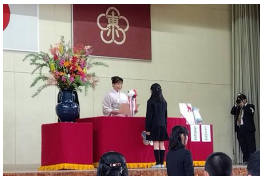
↑ 校長先生から卒業証書もらう6年生

6年生58名の皆さん、これまで太宰府東小学校の最上級生として、色々な場面で頑張ってくれました。ありがとうございました。中学校での活躍を心から祈っています。いつまでも応援しています。