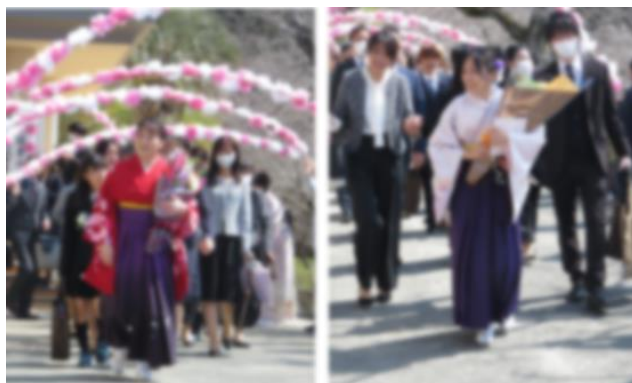
↑ 5年生に花のアーチを支えてもらい、お見送りしました