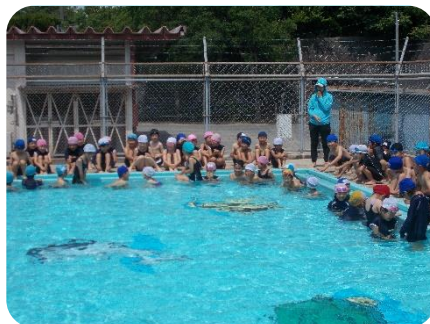
↑ 肩まで水につかる 1 年生