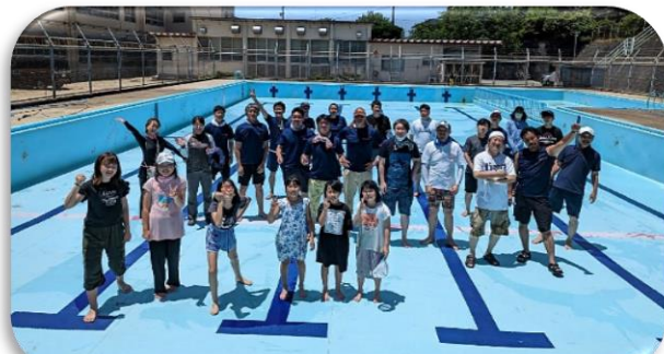
↑ 仕上げ磨きをしてくださった「おやじの会」の皆さん

二つ目は、「自分の目標を決めて、頑張る」ことです。プールでの学習は、個々人の能力差が大きい実態があります。だからこそ、自分の目標を決めて、目標に向かってチャレンジする経験を積み重ねてほしいと考えています。学級でも目標設定をしたいと思います。ご家庭でも話題にあげていただき、子どもたちが自分の目標に向かってチャレンジする姿を褒めてください。よろしくをお願いいたします。