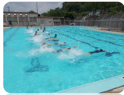
↑ プールの横の距離を泳ぐ 6 年生