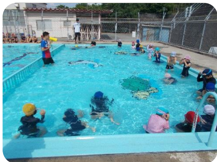
↑ 頭まで水にもぐる 2 年生