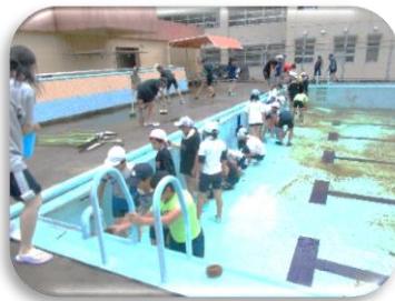
↑ プールサイドを磨く 5 年生と中を磨く 6 年生

さて、プール開きの会で、私は、子どもたちに次のような話をしました。まずは、6月2日(金)にプール掃除をしてくれた5年生、6年生の様子を写真で伝え、4年生までの児童とともに「ありがとうございました」と言葉掛けをし、感謝の気持ちを表現しました。そして、6月3日(土)「おやじの会」の皆さんが仕上げ掃除をしてくれたことを伝えました。「おやじの会」の皆様、暑い中、仕上げ磨きをしていただきありがとうございました。