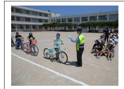
交通安全教室の様子（4年生）

5月18日（水）に運動場で1年生と4年生年生が交通安全教室を行いました。地域の交通安全指導員の方、筑紫交通安全協会の方、太宰府市の防災安全課の方、筑紫野警察署交通課の方、筑紫野自動車学校の方に来ていただき、運動場で横断歩道や、信号機を取り付けて行いました。1年生は、標識を見て横断歩道の渡り方を学ぶことができました。4年生は、正しい自転車の乗り方を学びました。大切な命を守るためにもぜひ、学んだこと生かして行ってほしいと思います。