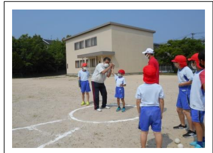
ソフトボール投げの様子

5月23日（月）～27日（金）まで体力テストを行いました。1年生は、6年生とペアを組んでやり方を教えてもらいながら楽しく行うことができました。また、スポーツ推進委員の方には、暑い中来ていただき体力テストのアドバイスや記録などの補助をしていただきとてもありがたかったです。