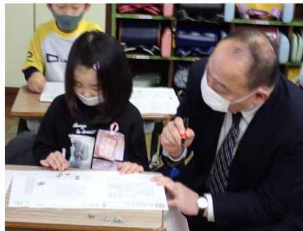
集中して問題を解く低学年児童

今後も、この結果を十分に分析し、更なる伸びにつながるよう取り組んで参ります。それぞれのご家庭においても、宿題のノート・プリントの取組状況を確認したり、家庭学習への励ましやアドバイスの声かけをしたりしていただいていることに感謝申し上げます。