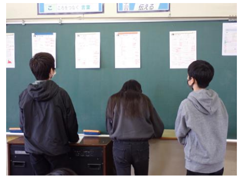
問題にチャレンジし、自己採点する高学年児童