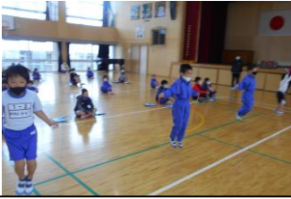
縄跳びを跳ぶ1年生と感染防止のため、距離を取って後ろから数を数える6年生

今年は、新型コロナウイルス感染防止対策のため、時間を決めて1クラスまたは、2クラスで実施しました。この日に向けて、子どもたちは体育の時間や休み時間を使って縄跳びの練習を続けてきました。1月26日(水)、自分の目標に向かって努力する子どもたちの姿が見られました。また、数を数える高学年が縄跳びを終えた低学年の児童に「がんばったね」「目標達成だね」などと温かい言葉をかけている姿が見られ、私もとてもうれしくなりました。終わった後に、鍛え合い委員会の皆様が、縄跳びチャレンジカードにシールを貼ってくださいました。ご家庭では、縄跳びチャレンジに向けた努力の過程を褒めていただければと思います。