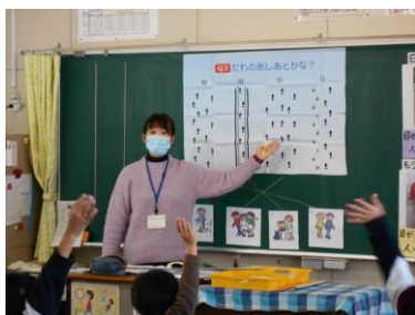
2年生での人権学習の様子

参観していただくことは出来ませんでした。1月は、各学年で「人権学習」に取り組みました。今、新型コロナウイルス感染防止対策で、人との距離を取ったり、なるべく声を出さなかったりと、ともすると人との繋がりも切れそうな状況が生まれています。