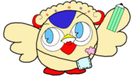
【マスコットキャラクター：うーちゃん】