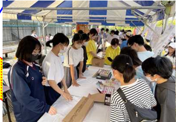
【夏まつり：運営参加】