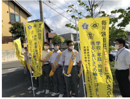
【にしの日：あいさつ運動】