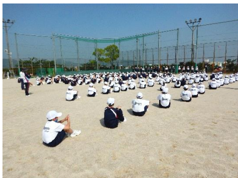
赤B リーダーが元気に自己紹介をしていました