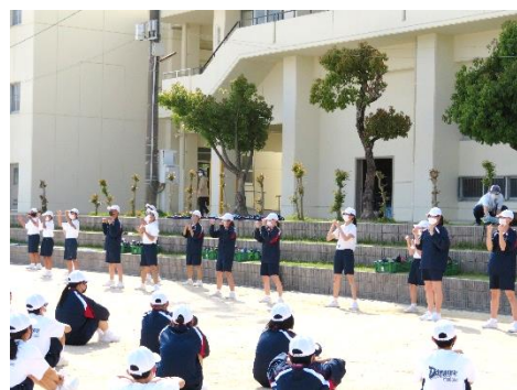
青B リーダーが手本を見せています