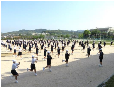
黄B 唯一、ブロック全体で演技を合わせました