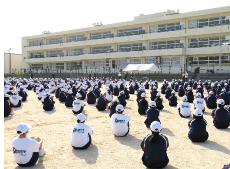
全体会で今日の練習を振り返っています