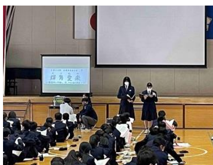
1年生の4時間目は生徒会 OR でした。生徒会執行部が丁寧に説明をしてくれました