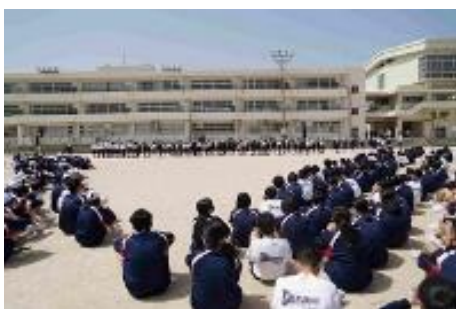
3学年が初対面しました