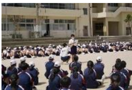
1年代表あいさつ 元気に発表