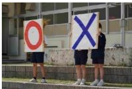
○×ゲーム、盛り上がりました