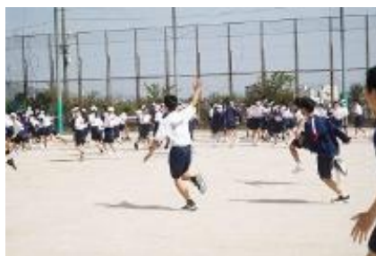
増え鬼が始まりました