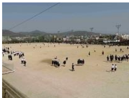
グラウンドをいっぱいを使って鬼ごっこ！ 盛り上がりました！

これから、どの学年もたくさん活動をして、太宰府西中学校を大いに盛り上げてくれると思います。今後の太西星に期待します！