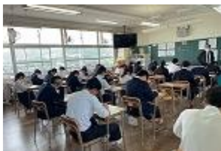
3年生テストに奮闘中です