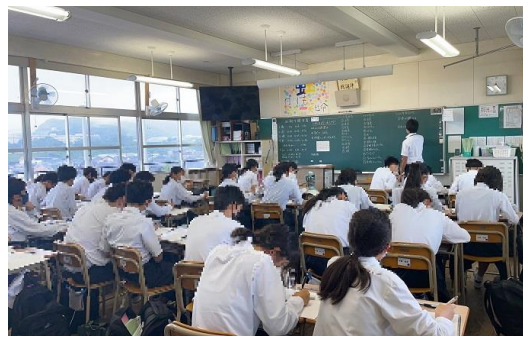
2年理科：ポイントを黒板に書いています