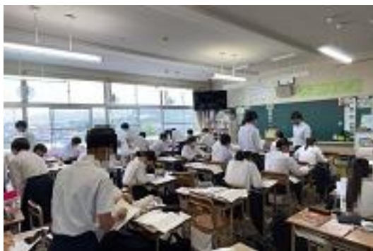
3年生：全て1教室で、色々な教科を学習しています