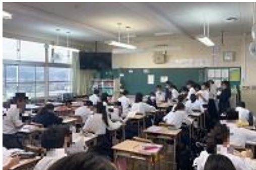
1年生社会：問題を解いています