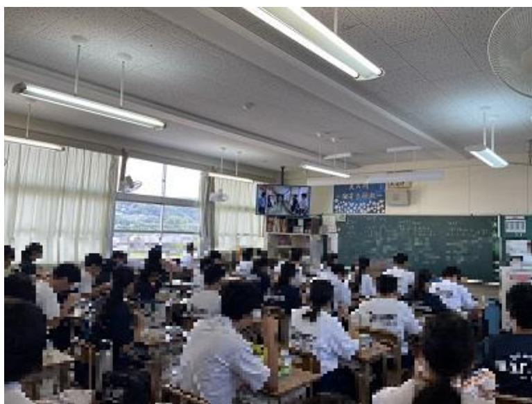
3年生のあるクラスでの視聴している様子です

全校生徒の皆さんは今週の放送を見て、心を込めて掃除をしてくれるようになってほしいと思います。