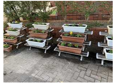
【秋の花苗 植え替えのようす】

作業される保護者の方に、「ありがとうございます」と御礼を言う生徒の姿が見られました。自分たちや学校のために多くの方々に関わってくださっていることに気づき、感謝の気持ちをもっていることを嬉しく思います。