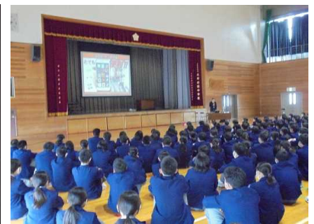
【情報モラル教室のようす】