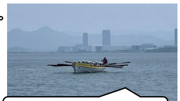
昨年のカッター訓練

5月30日から6月1日の2泊3日で、1年生は自然教室に行きます。宿泊場所は、海の中道青少年海の家です。天候にもよりますが、海上でのカッター訓練や、海の中道海浜公園内でのウォークラリー等を予定しています。3日間、寝食を共にし、活動することで、お互いのことをよりいっそう知り、絆が深まります。また、係活動をとおして、自主的な活動ができるようになります。多くの自然とも触れ合うことができるようになります。さらに、集団行動をとおして、時間を守ったり、マナーある行動をしたり、お互いに思いやりをもった行動をしたりすることができるようになります。このように自然教室はとても意義のある活動です。