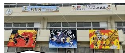
昨年のパネルとスローガン

果たして第39回体育会でどのような感動を味わうことができるのか、どのようなドラマが生まれるのか。とても楽しみです。