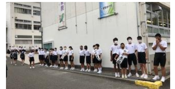
朝の選挙運動の様子