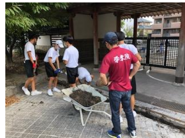
溝掃除する2年生男子