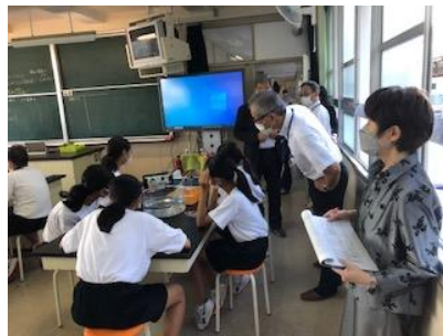
太宰府市教育委員会の訪問

○生徒が明るく元気がある。学校の集団の中で明るく振舞うことは周りの視線が温かくなければできない。授業中の挨拶が良いのは先生と生徒の関係が良いこと。 ○交流活動の場面で自由な発言でも認め合う雰囲気を感じられた。 ○ICTの活用も様々な活動(オンライン配信、ロイロノートの活用、デジタル教科書等)がなされ、次のステージに入っていると感じた。 ○学中を訪問するとエンターテイメントの中にいるようで楽しく感じられた。 ○地域貢献活動では防災訓練も視野に入れて、検討していただきたい。 ●授業はテンポよくしていたが、中にはついていけない生徒もいるように感じた。一人ひとりのつまずきも大切にしてほしい。 ●どの学校にも言えることだが、表現力が弱い。表現の仕方(人権感覚も含めて)をさらに強化してほしい。