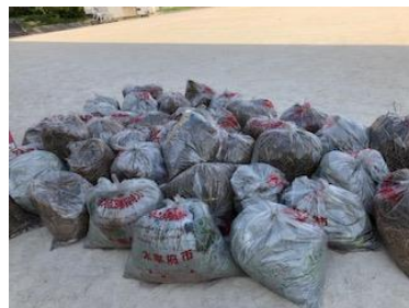
集められた草や木

2年生による愛校作業が行われました。2年生280名がグラウンドの草取りや溝の清掃などに一生懸命に取り組んでいました。9月3日の「学中の会」や「ボランティアの会」で草切りをしていただいていたので、スムーズに行うことができました。地域コーディネーターの方にもお手伝いしていただきました。