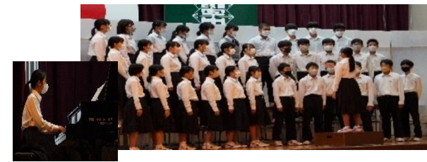
2年6組「変わらないもの」