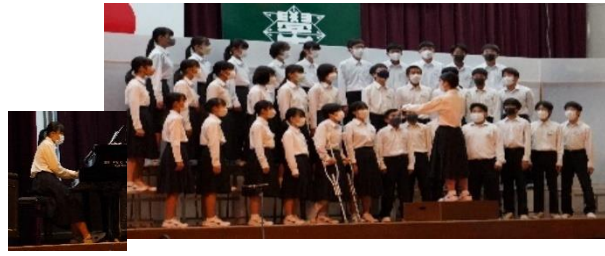
2年2組「空駆ける天馬」