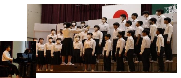
2年7組「生きている証」