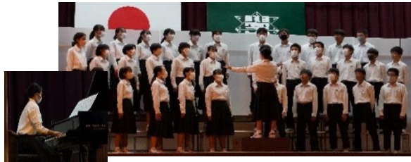
2年3組「瑠璃色の地球」