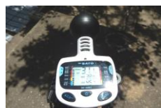
熱中症指数測定器

数値が31を超えたら、運動場の遊びをやめて、教室に入って水分補給をするようにしています。こまめに状況をみながら、子どもたちの健康・安全を守れるように声をかけていきたいと思ひます。熱中症予防のためには、マスクを外す指導もしています。さらに、熱中症の危険は屋外だけとは限りません。屋内でもこまめな水分補給をするなど、熱中症予防のために声をかけたいと思ひます。