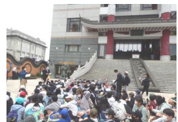
体験活動前の集合の様子

学び、協力、思い出という修学旅行のめあてを達成した6年生の今後の活躍と成長を期待しています。