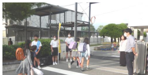
水城小の門前の挨拶運動の様子

学院院中学校ブロックで、9月20日（水）～22日（金）の3日間、あいさつ運動をしました。いつも地域の方々が登校見守りをしてくださっている場所に、中学生も立って挨拶運動をしました。いつもより意識をして挨拶をすることで、気持ちのよい挨拶の輪が広がりました。これからも気持ちのよい挨拶が続くとよいですね。