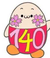
140周年キャラクター の「みずきっち」

創立150周年記念のキャラクターを募集したところ、とてもたくさん集まりました。企画委員会で絞り込んで、10の候補が決まりましたので、子どもたちや保護者や地域の方々に、一人一票で投票をしてもらって決めることにしました。保護者の方は、参観日に受付に投票用紙を置いてありますので、PTA会議室前(北棟)か放送室前(グレイ棟)の掲示を見て、ぜひ、投票をしてください。地域の方も、ご来校の際には、キャラクター掲示コーナーの投票用紙で投票をお願いします。