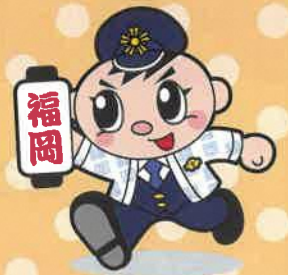
福岡県警察 シンボルマスコット 「ぶっけい君」