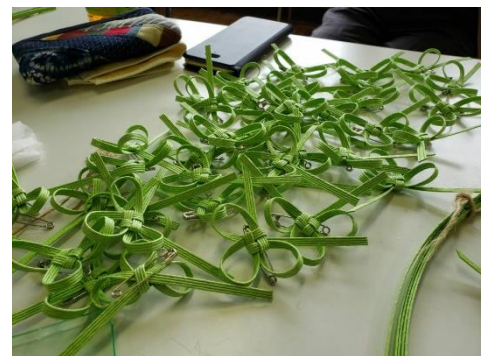
100個以上作りました！！

この活動はこれからも展開し、様々な取組を行う予定です。活動へのアイデアやご意見も募集中！