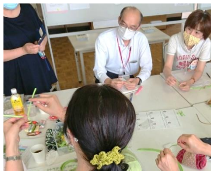
西村副校長先生も挑戦！