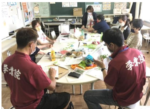
3校の地域コーディネーターみんなで作成