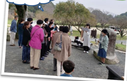
さかもとはちまんぐう 坂本八幡宮