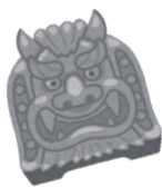
かいだんいん 戒壇院