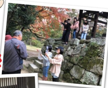
かんぜおんじ 観世音寺

11月7日(土)、「まほろば学習」のしめくりとして、校区内の史跡で、学習した内容を発表しました。6年生のみんなはたくさんの地域の方々、観光客、保護者の前で堂々と解説員ぶりを発揮しましたよ!