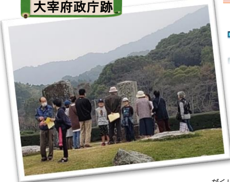
だざいふせいちやうあと 大宰府政庁跡

発行：水城小コミュニティ・スクール事務局 (水城小学校内 さくらルーム) OPEN：毎週水曜日 10:30~14:00 連絡先：092-923-3048 (水城小学校)