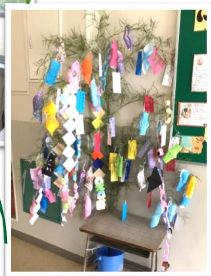
先生方がみんなで、 竹を運び込みました。