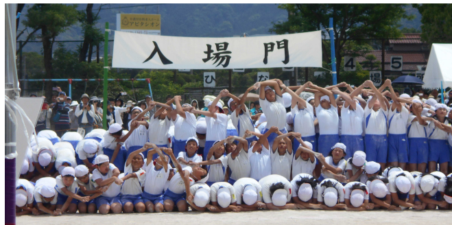
【5・6年生表現「創造」より】

当日の後片づけでも、運動会サポーターである6年生の保護者をはじめ、たくさんの保護者の皆様に快くお手伝いいただきました。皆様のご支援・ご協力のおかげをもちまして、すばらしい運動会ができたことに深く感謝申し上げます。