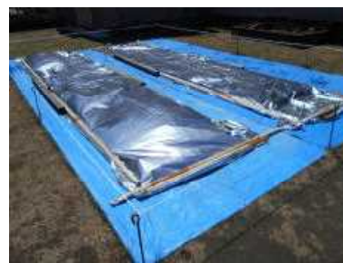
【もみを蒔いた苗箱】