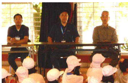
【米づくり名人の皆さん】

これからも本校の大切な文化として米づくりを継承・発展させていきたいと考えています。