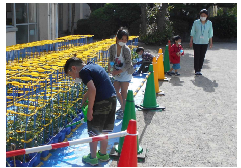
【ミニマトの苗に水をやる2年生】

保護者の皆様には、長期にわたる臨時休業中、お子さんの家庭での学習の見守りや通常と違う登下校への対応等にご協力いただき、ありがとうございました。引き続き登校前の検温や健康チェックカード記入、手洗いやうがいの励行、マスクの着用等お子さんの健康管理や感染防止対策へのご協力をよろしくお願いします。