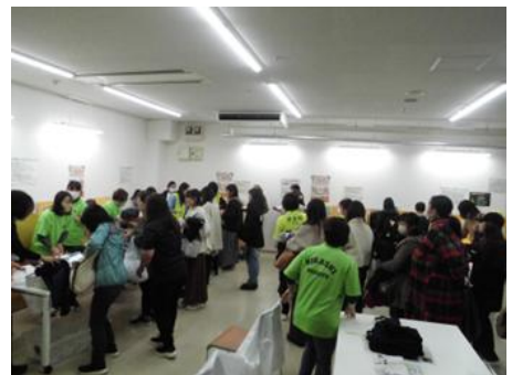
【大盛況のリサイクルバザー】

11月24日(祝・月)は、10:00~13:00まで、太宰府市のいきいき情報プラザ1Fで、市内4中学校合同による制服リサイクルバザーを行いました。新しい制服に切り替わって、初めてのリサイクルバザーだったため、当日は、たくさんの保護者・生徒の皆さんが詰めかけました。もしかしたら全ての方の希望には添えなかったかもしれません。