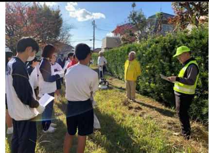
【水城ヶ丘地区の活動】