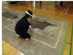
【ゴーグルの装着体験】