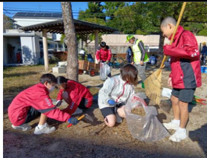
【観世音寺地区の活動】

11月21日(金)は、午後から各地域に分かれて地域貢献活動の時間でした。国分地区は、体育館に集まって防災・防犯について確認を行いました。他の地区は、公民館や最寄りの公園などに移動をして、落ち葉を集めたり、花の苗を植えたり、細かな草取りをしたりして、普段お世話になっている地域への恩返しの活動を行いました。地域の方々からお礼の言葉をいただきました。