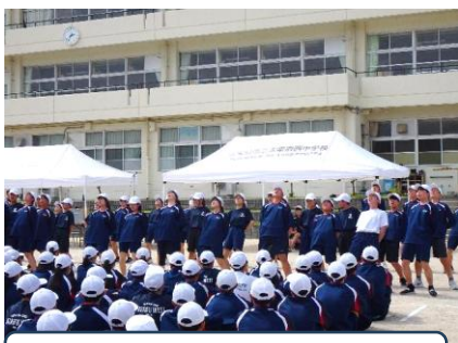
リーダーによる校歌斉唱

練習初日から、実行委員やリーダーが気合の入った大きな声で指示を出し、主体的に動く姿が見られました。ブロックや全校生徒という、大勢の人を動かしていくことは並大抵のことではなく、うまくいかないことや壁にぶつかることもたくさんあるでしょう。しかし、様々な人の立場を考え、互いに支え合って気持ちが一つになったとき、そこには、一人では味わうことができない、大きな感動と達成感が待っています。リーダーもフォロワーも互いを思いやり、決してあきらめず粘り強く取り組み、太宰府西中学校の最高到達点を目指して頑張してほしいと願っています。