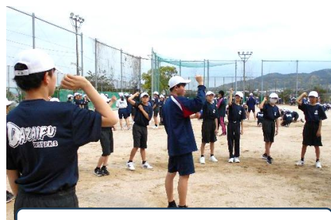
ブロック演技の練習